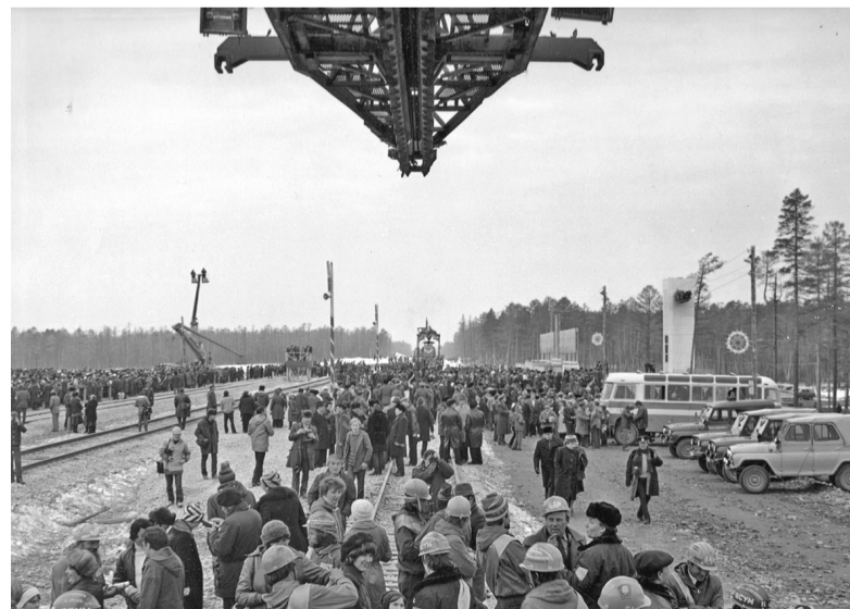
Укладка золотого звена в Куанде