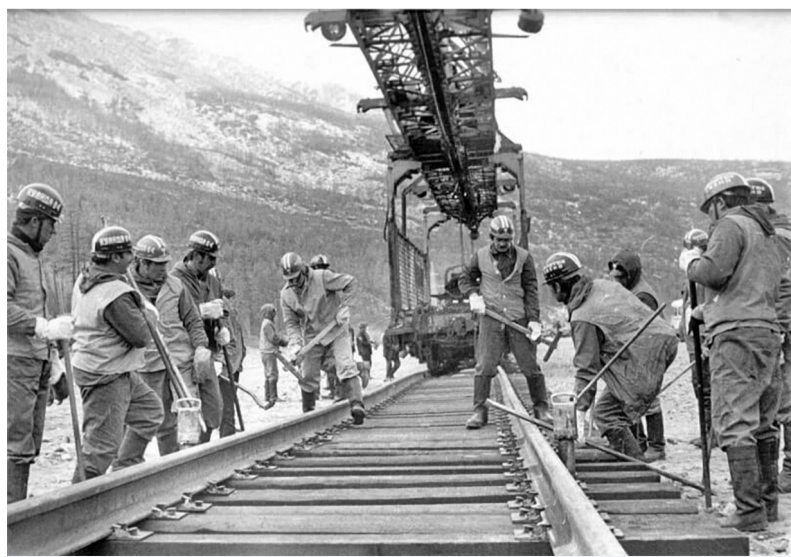
Бригада Бондаря в Балбухте

В статье использованы материалы программы «Монологи о БАМ» телекомпании «Ариг Ус», фото документального проекта «БАМ 50» и музея истории БАМ в г. Тында